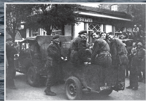
Den første engelske jeep, der kom til Gilleleje efter Befrielsen.