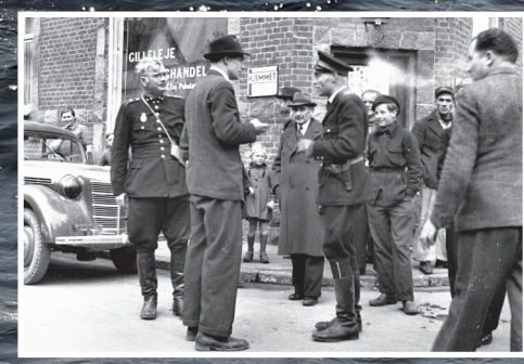
Diskussion om eftersøgte stikkere.

Den tyske aktion mod jøderne i Danmark natten til den 2. oktober 1943 udløste en modstand i den danske befolkning, som tyskerne ikke havde forudset. Folk fra alle samfundslag deltog i redningen af deres landsmænd. For mange blev Gilleleje symbolet på flugten, der lykkedes, men også på tragedien, da 60 jøder blev taget på Gilleleje kirkes loft.