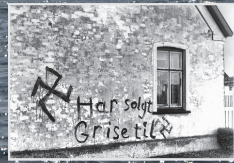
Påmalet nazi-kors og tekst, der fortæller om ejerens salg af svin til besættelsesmagten.