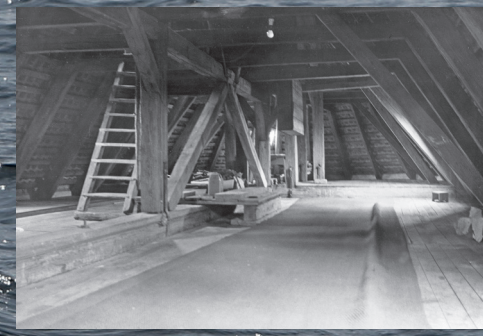
Gilleleje Kirkes loft, hvor mange jøder gemte sig for Gestapo.