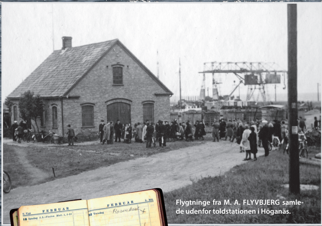
Flygtninge fra M. A. FLYVBJERG samlede udenfor toldstationen i Höganäs.